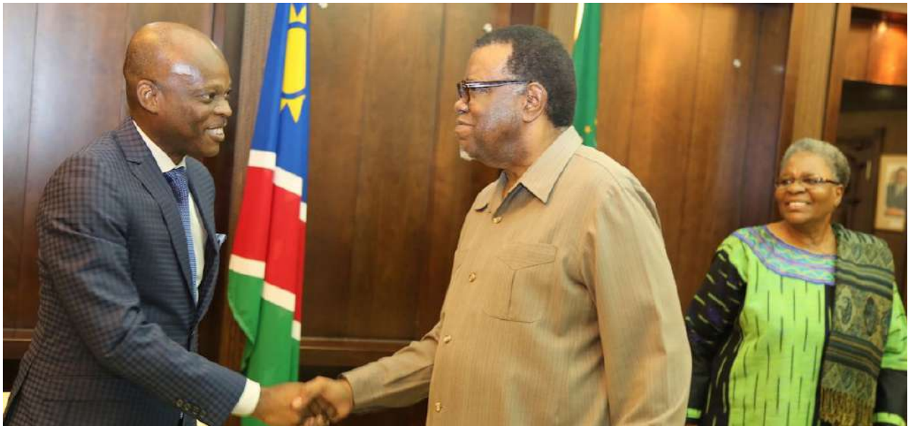
De gauche à droite: Prof. Robert DUSSEY, Chef de la Diplomatie Togolaise, S.E.M Hage GEINGOB, Président de la Namibie/ From left to right: Prof. Robert DUSSEY, Togolese Diplomacy Head, H.E.M Hage GEINGOB, President of Namibia