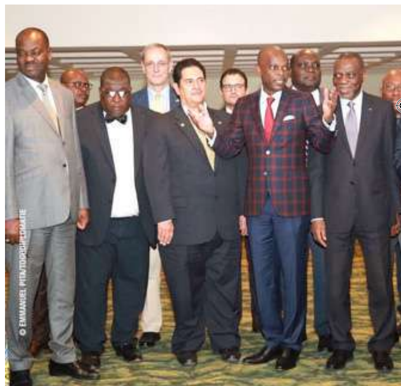
Photo de famille / Family photography