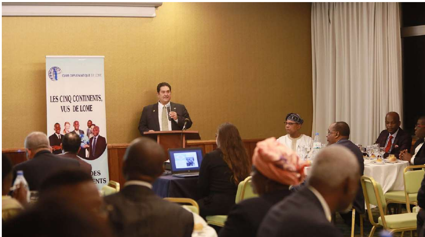
S.E.M Antonio de SALLES MENEZES lors de sa présentation / H.E.M Antonio de SALLES MENEZES in his communication

The members and guests of the Diplomatic Club of Lomé met on April 20, 2018 at Hotel Sarakawa, where the eleventh conference of the think tank of Togo's Ministry of Foreign Affairs, Cooperation and African Integration was held on the theme: "Togo and Brazil, an undeniable geographic and cultural proximity"