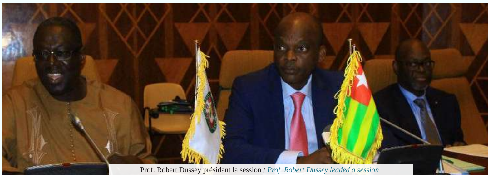
Prof. Robert Dussey présidant la session / Prof. Robert Dussey led a session