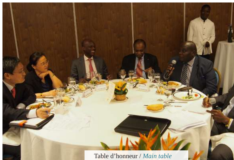
Table d'honneur / Main table