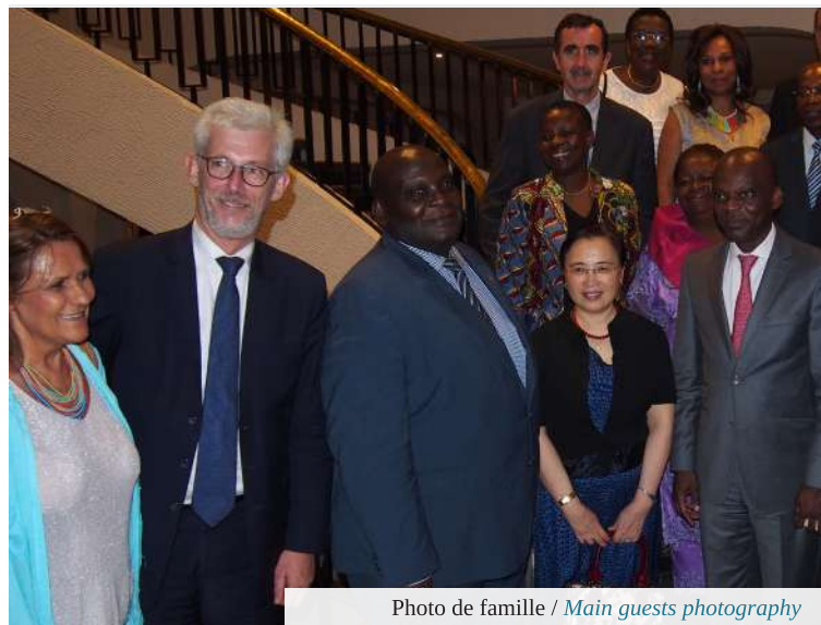
Photo de famille / Main guests photography