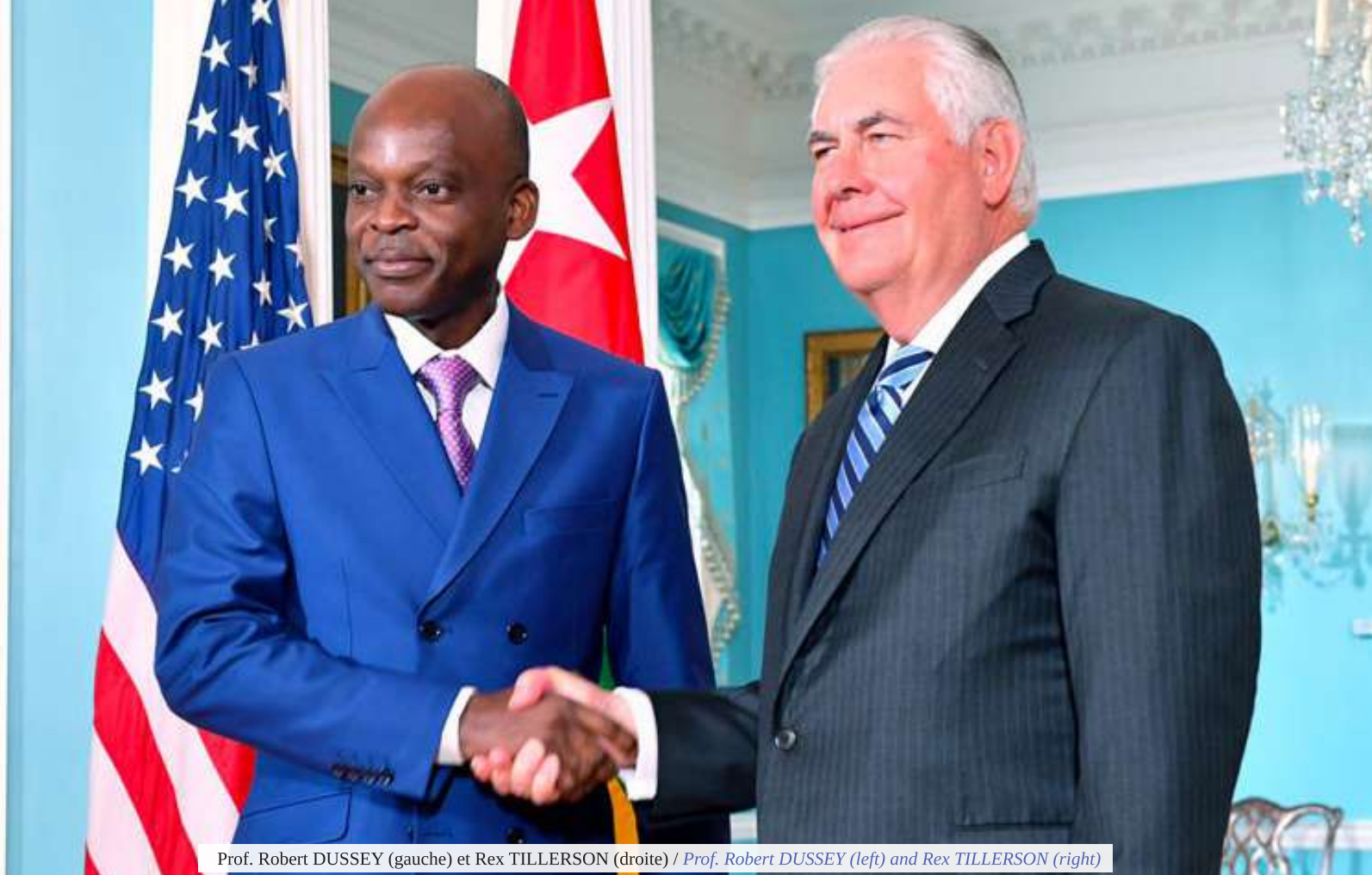
Prof. Robert DUSSEY (gauche) et Rex TILLERSON (droite) / Prof. Robert DUSSEY (left) and Rex TILLERSON (right)

ACOTA (African Contingency Operations Trainings) dont bénéficie le Centre d'Entraînement aux Opérations de Maintien de la Paix (CEOMP) de Lomé.