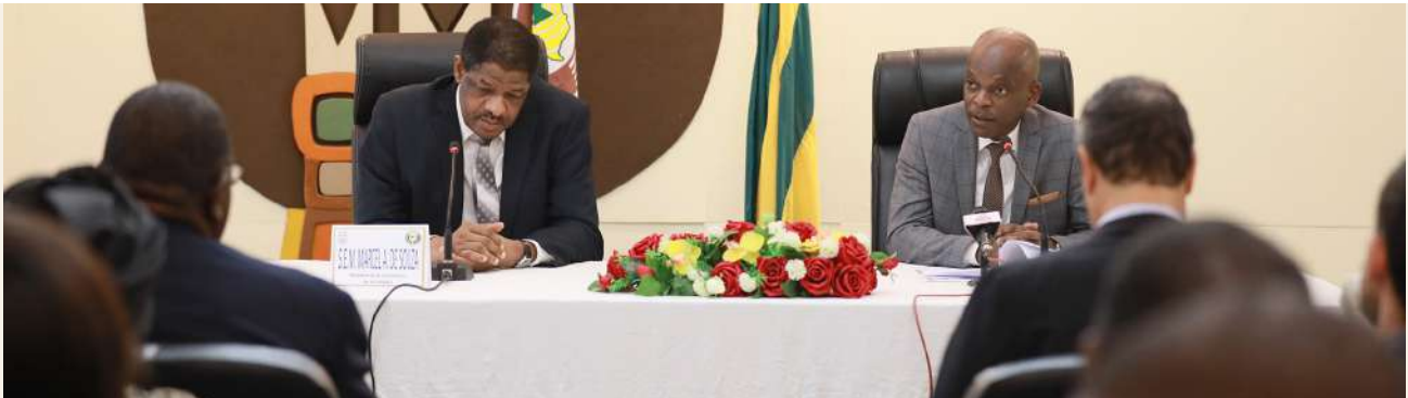
M.Alain de SOUZA (g) Président de la commission de la CEDEAO et Pr. Robert DUSSEY (d), Chef de la Diplomatie Togolaise lors de la présentation du programme du Togo pour la CEDEAO / Mr.Alain de SOUZA (left), Head of ECOWAS Commission, and Pr. Robert DUSSEY (right) during the presentation of Togolese Agenda to ECOWAS