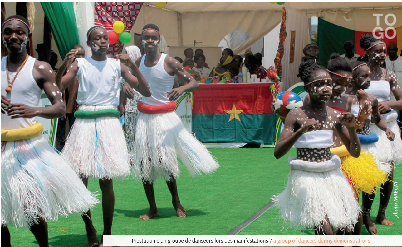
Prestation d'un groupe de danseurs lors des manifestations / a group of dancers during demonstrations