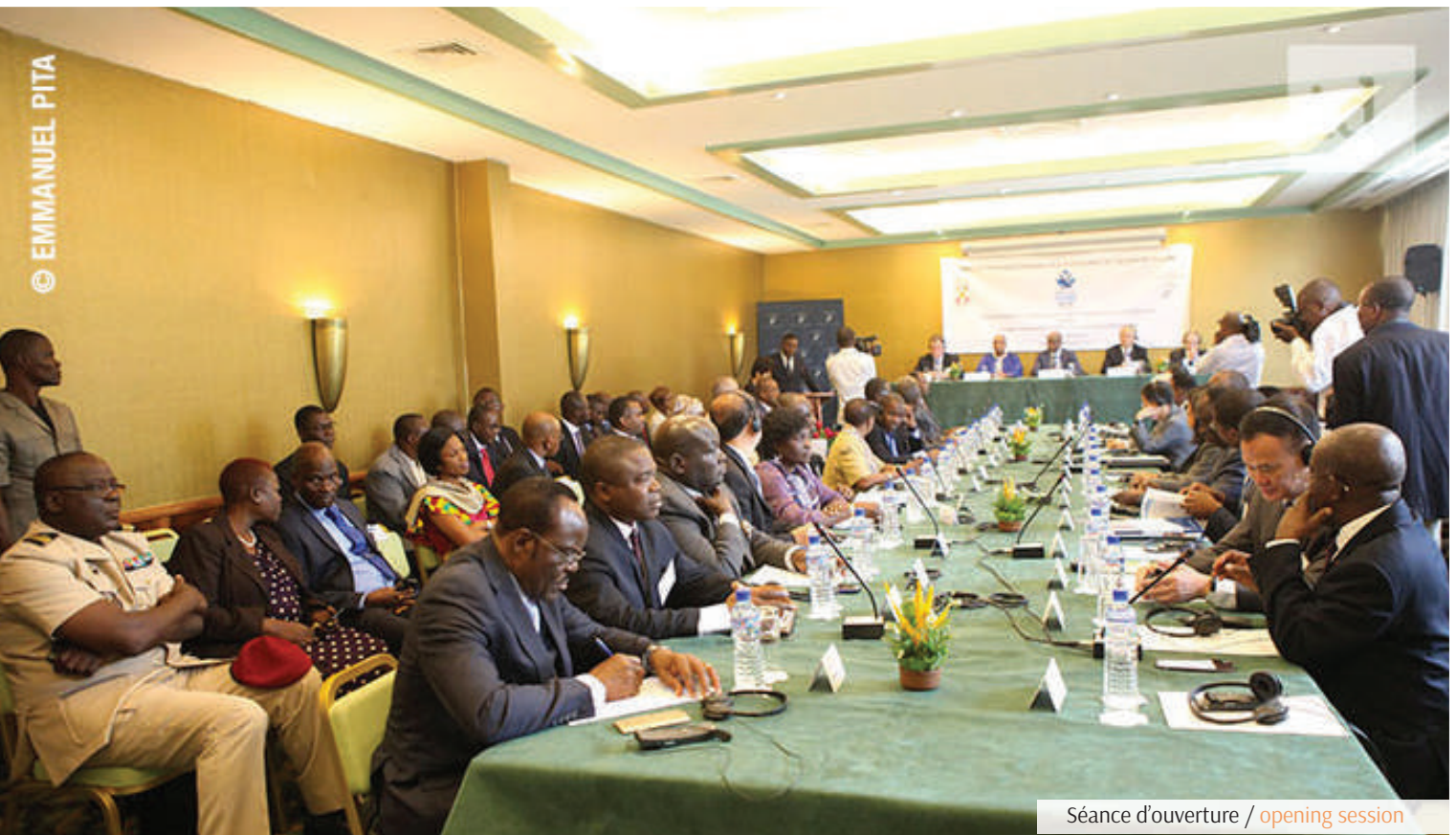
Séance d'ouverture / opening session

TWO MAJOR POWERS FOR THE SAME OBJECTIVE IN LOME