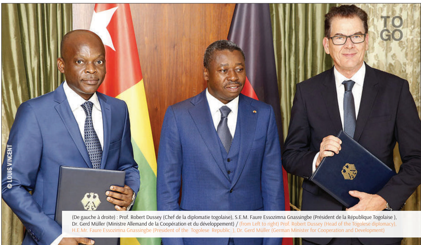
(De gauche à droite) : Prof. Robert Dussey (Chef de la diplomatie togolaise), S.E.M. Faure Essozimna Gnassingbé (Président de la République Togolaise ), Dr. Gerd Müller (Ministre Allemand de la Coopération et du développement) / (from Left to right) Prof. Robert Dussey (Head of the Togolese diplomacy), H.E.Mr. Faure Essozimna Gnassingbe (President of the Togolese Republic ), Dr. Gerd Müller (German Minister for Cooperation and Development)

Faure Essozimna GNASSINGBE has also demonstrated to its German hosts that the ambitious investment programs launched by Togo can only succeed with the continued support of the private sector. That is the reason why the Togolese President →