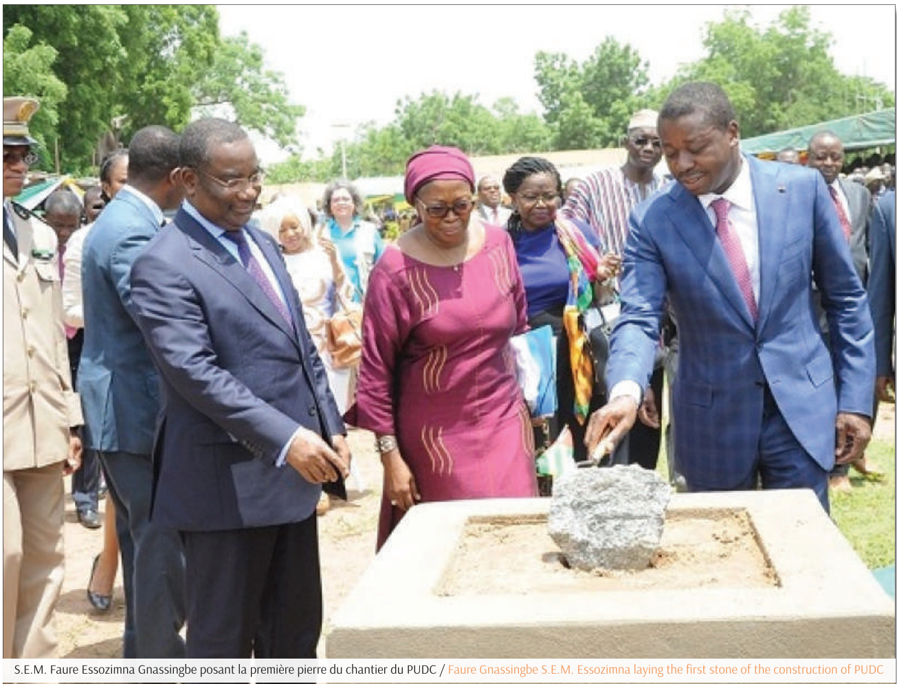
S.E.M. Faure Essozimna Gnassingbe posant la première pierre du chantier du PUDC / Faure Gnassingbe S.E.M. Essozimna laying the first stone of the construction of PUDC

R eaffirming his commitment to fight against poverty and his care for social problems as enshrined in his social program and as explained to the Togolese people during the 2015 Presidential elections, the President of the Republic, His Excellency Mr. Faure Essozimna GNASSINGBE launched on June 30, 2016 in Mandouri (500mi. North of Togo) the emergency →