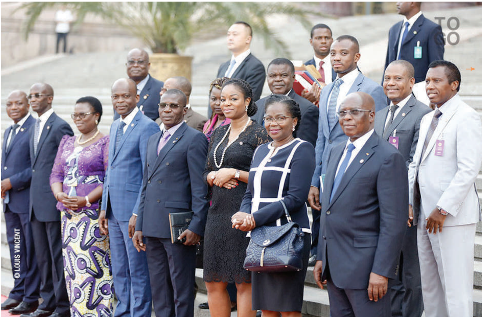
Photo de la délégation togolaise / Togolese delegation

Lomé and Beijing are currently in a major phase of structural economic and development reforms. →