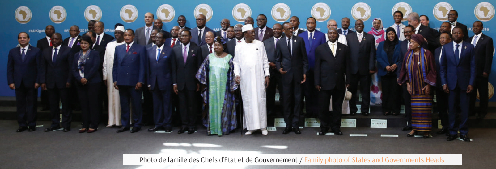
Photo de famille des Chefs d'Etat et de Gouvernement / Family photo of States and Governments Heads

La protection des femmes, le financement de l'Union, la succession de madame N'kosazana Dlamini Zuma à la tête de la Commission de l'UA, les questions sécuritaires et la mise en place d'un passeport africain constituent, entre autres, les principaux axes qui ont été débattus par les Chefs d'Etat et de gouvernements.