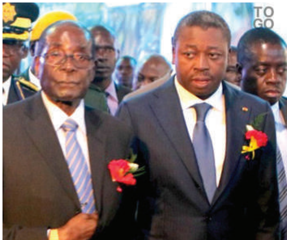
Les Présidents Robert Mugabé et Faure Gnassingbé / Presidents Robert Mugabe and Faure Gnassingbé

The diplomatic revival begun in Togo in recent years is bearing fruit through diversification of diplomatic ties between Togo and foreign States. This new vision of the Togolese diplomacy, intended as a diplomacy for the sake of development, arouses renewed interest from partners of Togo.