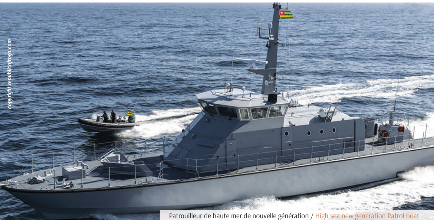
Patrouilleur de haute mer de nouvelle génération / High sea new generation Patrol boat

MARITIME SECURITY: REACT TOGETHER IS UNAVOIDABLE