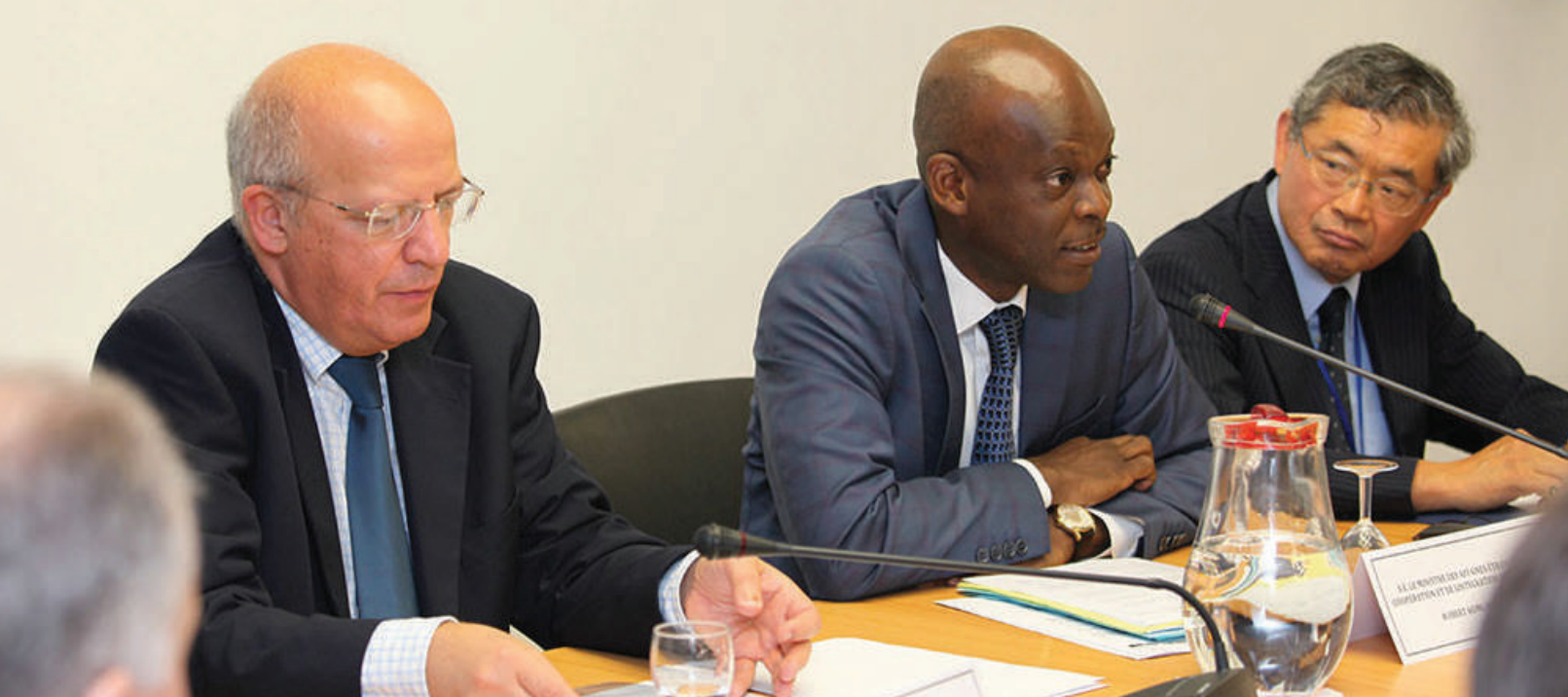
Augusto Santos Silva et Robert Dussey (Ministres des Affaires Etrangères Portugais et Togolais) / Augusto Santos Silva and Robert Dussey (Portuguese and Togolese Ministers of Foreign Affairs)