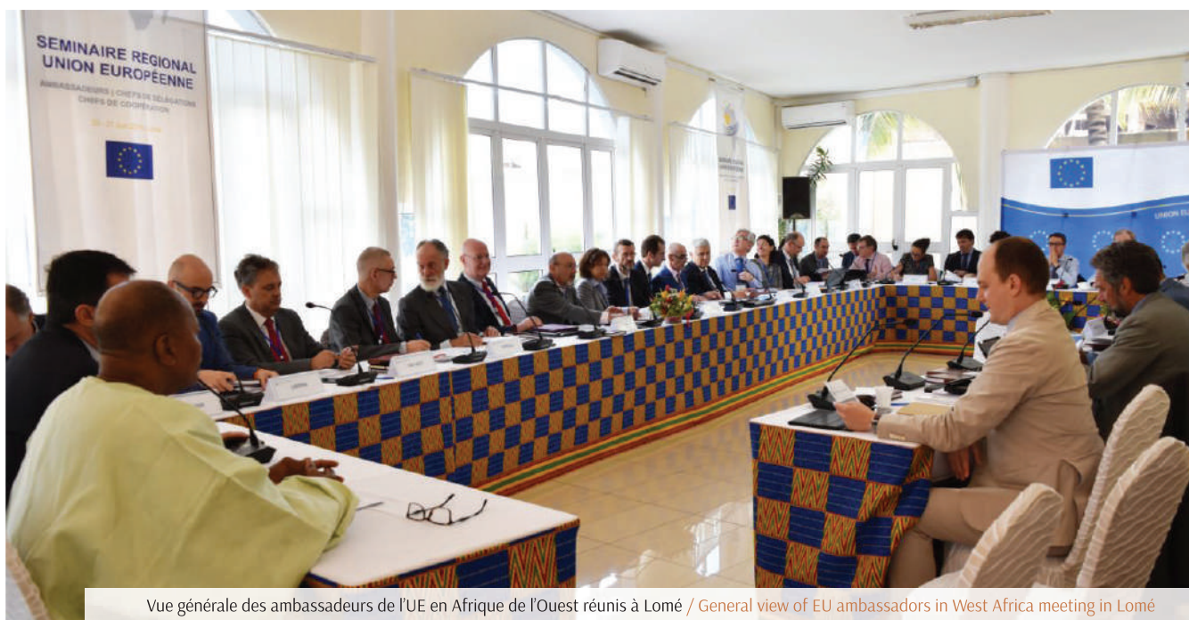
Vue générale des ambassadeurs de l'UE en Afrique de l'Ouest réunis à Lomé / General view of EU ambassadors in West Africa meeting in Lomé