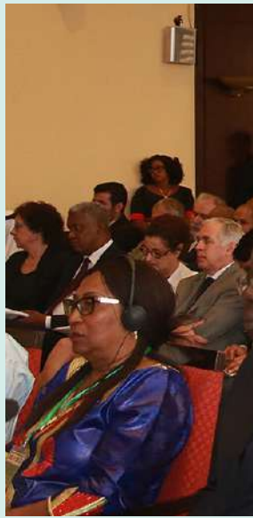
Faure GNASSINGBE entouré d'Ibrahim Boubacar KEITA, Président du Mali et Marcel Alain de SOUZA de la CEDEAO Faure GNASSINGBE surrounded by Ibrahim Boubacar KEITA, President of Mali and Marcel Alain de SOUZA of ECOWAS

L a question de la sécurité humaine de même que celle de la stabilité des territoires sont aujourd'hui devenues un enjeu majeur dans l'agenda politique international. La communauté internationale reste préoccupée par les ravages de l'insécurité et impliquée dans les différentes stratégies définies en vue de maintenir la paix et la sécurité partout. L'Afrique de l'Ouest et la région du Sahel, particulièrement, connaissent depuis quelques années une recrudescence de la violence armée caractérisée par la présence de groupes terroristes qui ont établi leur base dans plusieurs zones de la sous-région ouest-africaine. En sus, des activités illicites dangereuses telles que les trafics d'êtres humains, d'armes et de drogue, alimentent cette insécurité sous-régionale plongeant ainsi des pans entiers des territoires dans l'insécurité et l'instabilité. Cette situation est consécutive aux événements politiques intervenus au Maghreb et en Afrique de l'Ouest elle-même où de nombreux conflits internes ont contribué au cours des deux dernières décennies à y aggraver une situation d'insécurité. L'instabilité politique, les guerres civiles, ainsi que les problématiques socioéconomiques, notamment le sous-développement et la pauvreté ont fragilisé les Etats.