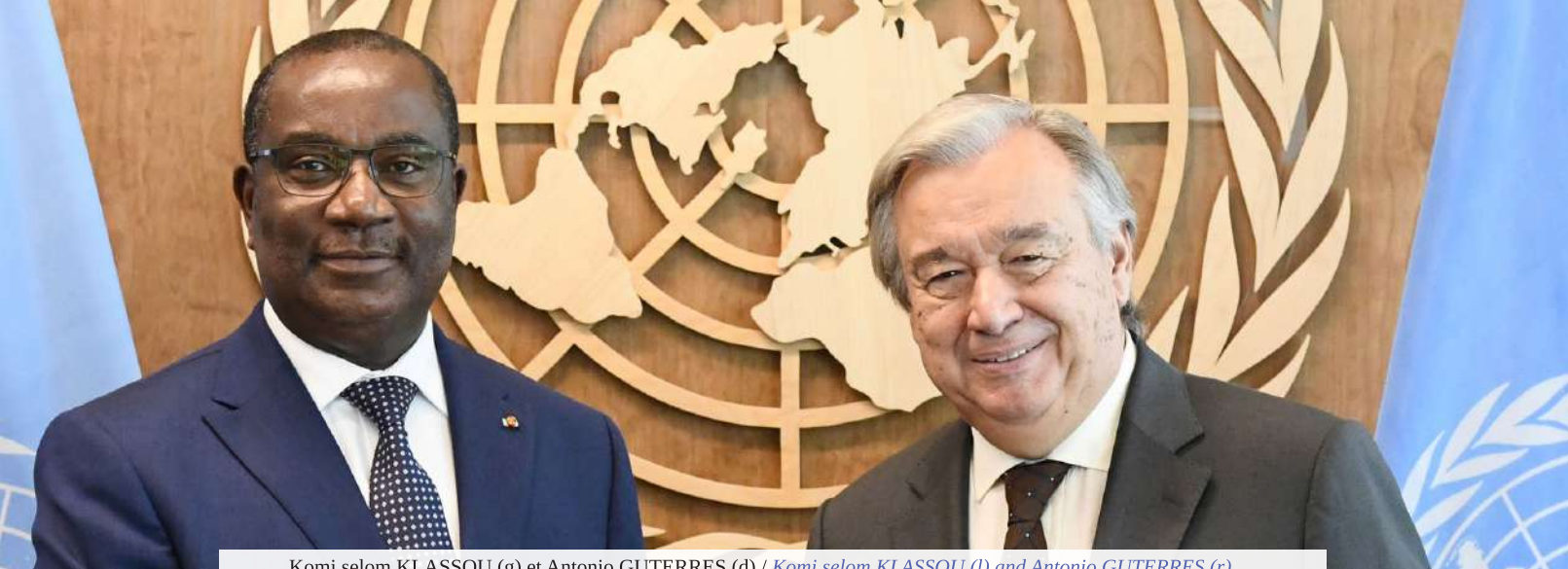
Komi selom KLASSOU (g) et Antonio GUTERRES (d) / Komi selom KLASSOU (l) and Antonio GUTERRES (r)

Communautaire (PUDC), par la mise en œuvre des actions prioritaires : l'entrepreneuriat rural, l'accès à l'énergie, à l'eau potable, l'autonomisation des femmes, l'agrobusiness, l'emploi des jeunes et la protection sociale. A cela s'ajoute une nouvelle initiative du gouvernement togolais, l'extension des cantines scolaires et le système de couverture médicale pour tous les écoliers et élèves qui bénéficient depuis quelques années de la gratuité de l'école publique.